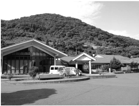
上関町高齢者保健福祉施設 (特別養護老人ホーム、在宅介護支援センター、デイサービスセンター、高齢者保健福祉センターが併設されています。)