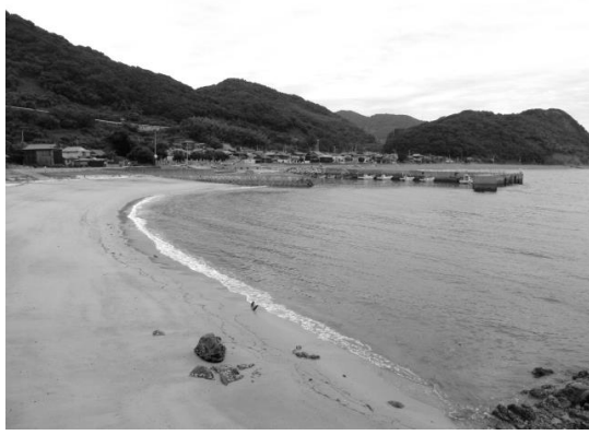
漁港の西側は砂浜になっていて、夏には海水浴に人気です。