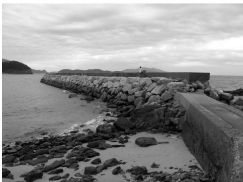
集落の端にある石の波止では、アジがよく釣れるそうです。