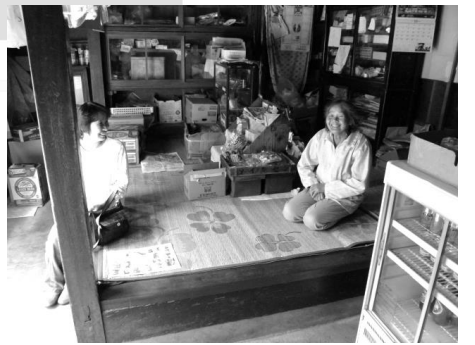
お店の中も懐かしい雰囲気になっています。