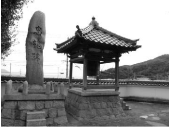
照光寺の鐘突き堂と忠魂碑