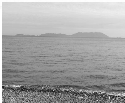
目の前に見えるのは八島です。