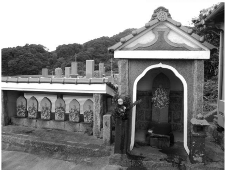
六地蔵と観音様は、その昔、萩のお寺からやって来られたそうです。