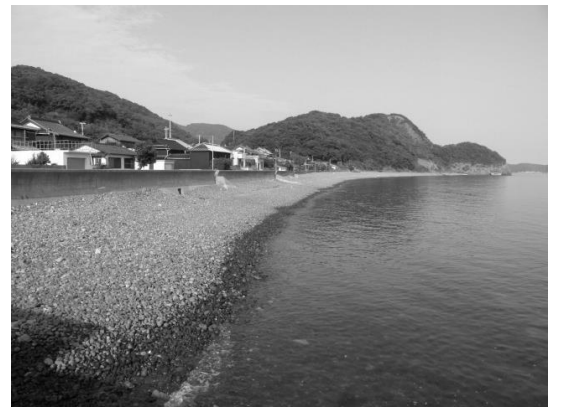
漁港の東側には美しい石の浜が続いています。