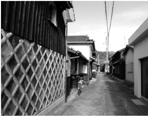
蒲井地区の懐かしい町並み