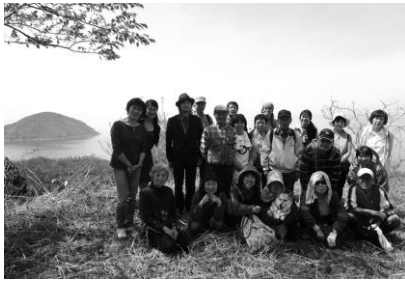
お花見ウォーク(2016年4月)

「周防灘30カイリ・潮の路路際間交流シンポジウム」に参加（大分県国見町）（2003年）