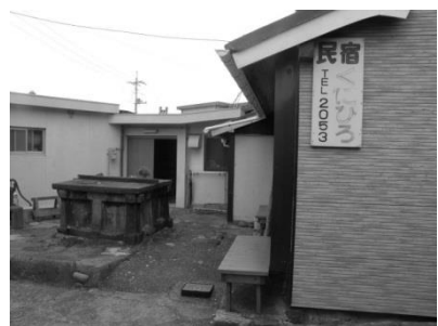
《上関町宿泊施設マップ》

【備考】新鮮な魚や野菜など島の食材を使った郷土料理。温かい家庭的な雰囲気もモットー。インターネット、祝島資料室、おみやげ品販売あり。港から徒歩3分。