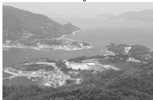
上盛山展望台から上関海峡を望む