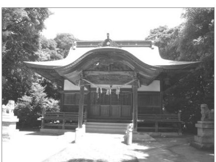
白井田八幡宮 港近くの鳥居をくぐり、木陰の階段を登っていくと、白井田八幡宮の立派な社殿があります。

白井田地区の現在の人口は約260人。くねくねとした細い路地の町並みは、まるで迷路を歩いているようで、冒険心を刺激されます。皆さんも白井田を訪ねて、ちよつと散歩してみませんか？