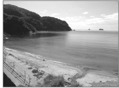
きれいな砂浜もあります。