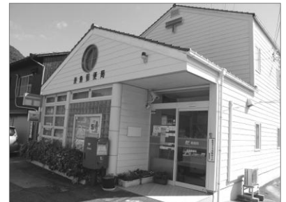
長島郵便局 白い局舎がとても素敵です。