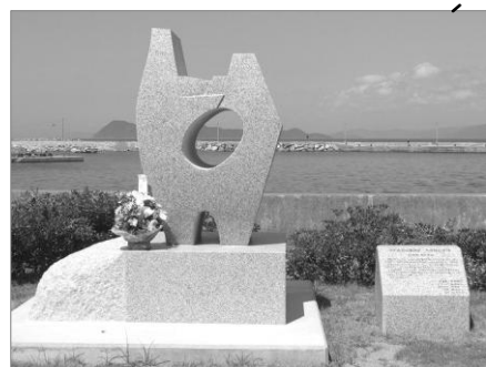
回天記念碑 昨年、公園内に建立された人間魚雷「回天」の記念碑。