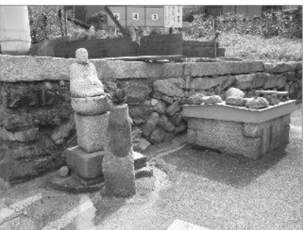
集落のあちこちで見かける井戸はお地蔵さんに見守られています。