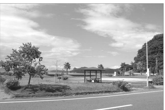
港の前には公園があり、無料の駐車場も整備されています。公園にはたくさんの植物が植えられていて、四季を通してさまざまな花が楽しめます。