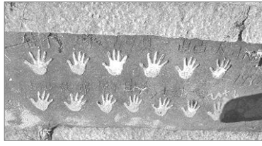
小学校の階段には子どもたちの手形が残っています。