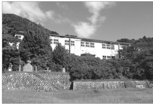
白井田小学校 海を見下ろす高台にあります。1993年に休校、2006年に閉校になりました。