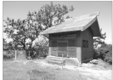
新宮大明神 防波堤近くにあります。漁業の神様とのこと。敷地内には、忠魂碑も建てられています。