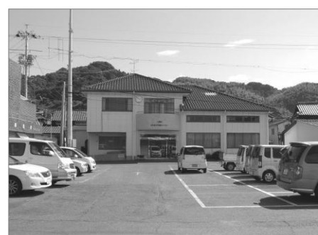
白井田文化福祉センター 地域のコミュニティセンターとして幅広く利用されています。トイレが建物の外側にもあるので、旅行者にも便利です。