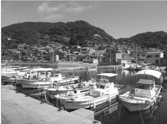
漁港から白井田の集落を臨む。