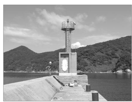
赤灯台 正式名称は「白井田防波堤灯台」。昭和51年11月初点の赤い灯台です。