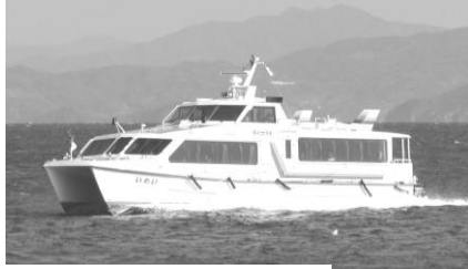
祝島航路 定期船「つわさ」