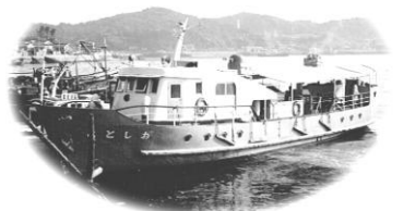
「ことしお」(昭和40年代)

◎「定期船の思い出」募集 定期船にまつわる、様々な思い出話を募集します。祝島や八島の定期船だけでなく、室津-上関の渡し船や海上タクシーの思い出も歓迎。たくさんの思い出話が集まったら、文集にまとめたいと思います。