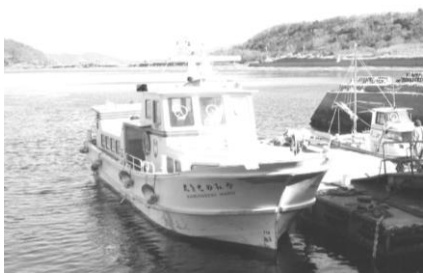
八島航路 定期船 「かみのせき丸」